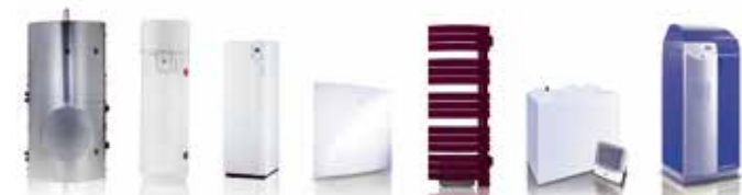
ПРОМИШЛЕНИ ВОДО-СЪДЪРЖАТЕЛИ УРЕДИ ЗА БИТОВА ГОРЕЩА ВОДА ТЕРМО ПМПИ ЕЛЕКТРИЧЕСКО ОТОПЛЕНИЕ ОТОПЛЕНИЕ ЗА БАНЯ ВЕНТИЛАЦИЯ БИТОВИ И ИНДУСТРИАЛНИ КОНДЕНЗНИ КОТЛИ

Портфолиото на Atlantic включва най-разнообразен избор на уреди, отговарящи напълно на нуждите на потребителите.